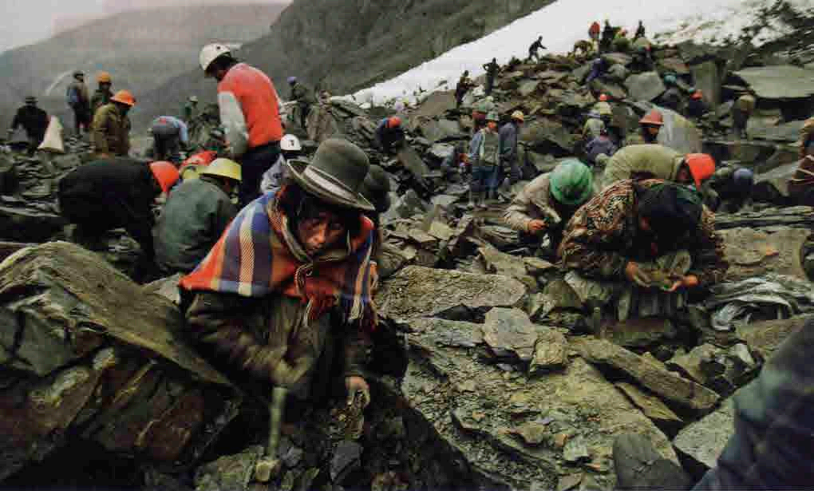
La exposición es también un registro del paso de la minería, la industria del caucho y la tala indiscriminada de árboles.