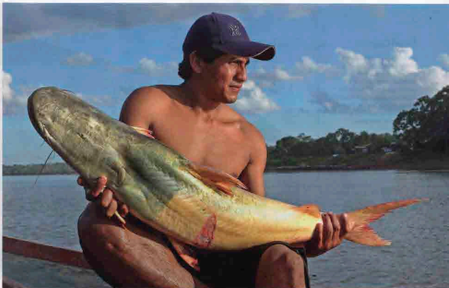
La pesca sostenible y el cuidado de los mares y ríos peruanos son temas claves para el lente del alemán Thomas Müller.